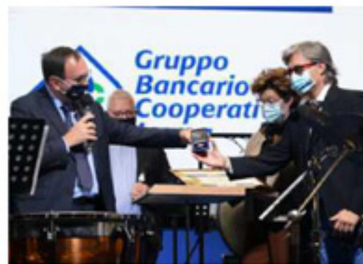
La consegna della targa di socio onorario alla moglie di Lorenzo Bergamini

Una serata pensata per ricordare Lorenzo Bergamini, attraverso una delle sue più grandi passioni, la musica, in quanto Presidente dell'associazione Cattaneo del Coro della Basilica di Treviglio.