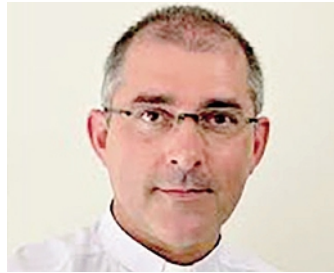
Monsignor Andrea Lembo, Vescovo a Tokyo CESNI

I premi saranno consegnati lunedì 28 febbraio, giorno di festa cittadina della Madonna delle lacrime, durante la cerimonia in programma alle 10,15 al Teatro Nuovo Treviglio. Il sindaco Juri Imeri commenta: «È sempre bello, in occasione della festa della Madonna delle lacrime, condividere un momento che valorizza e gratifica persone, associazioni, istituzioni che rappresentano al meglio la nostra città e che sono testimonianza dei valori che la caratterizzano».