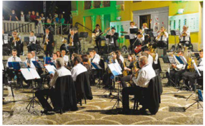
Immagini di repertorio del concerto dell'11 settembre 2021